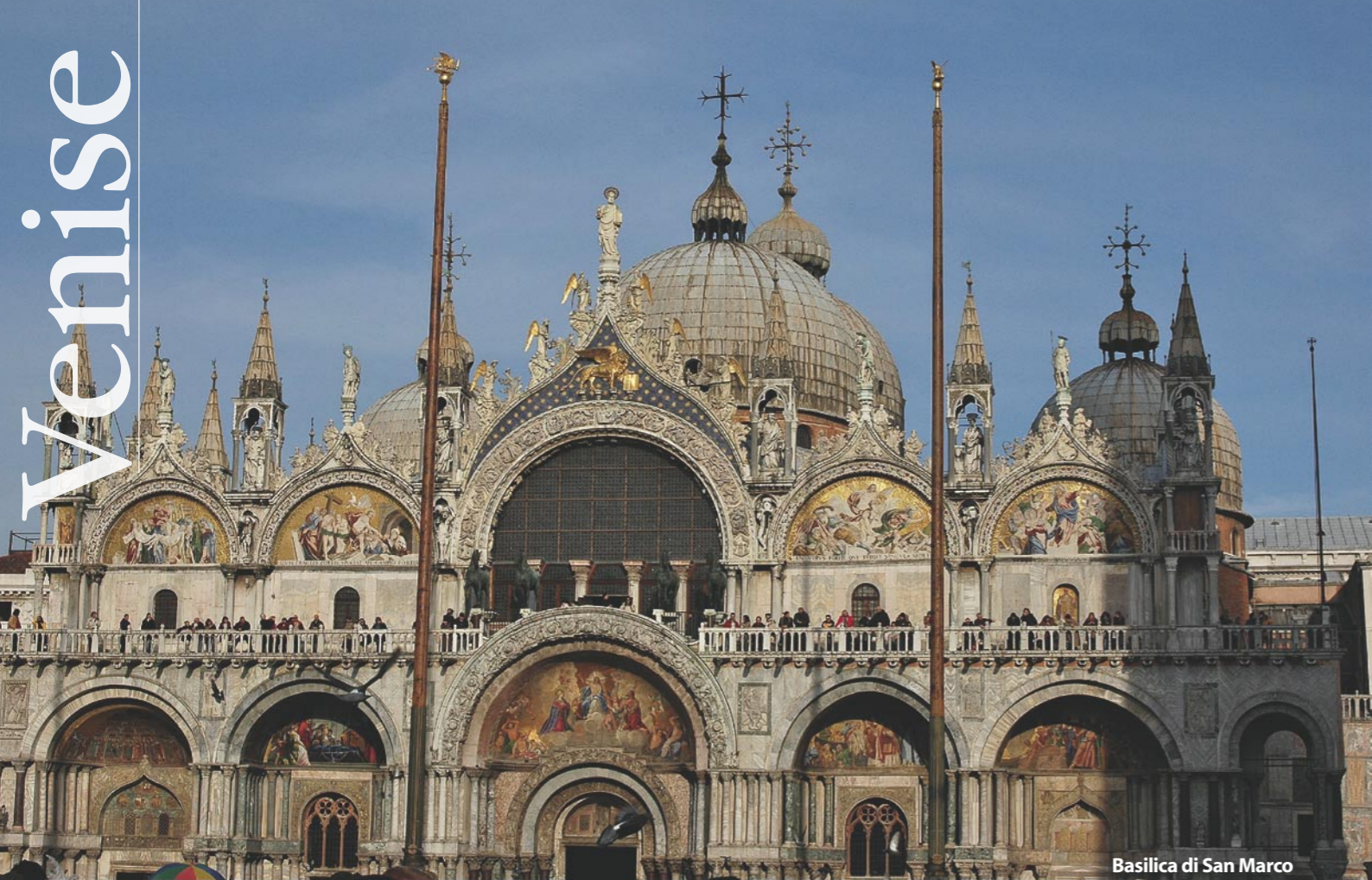
Basilica di San Marco