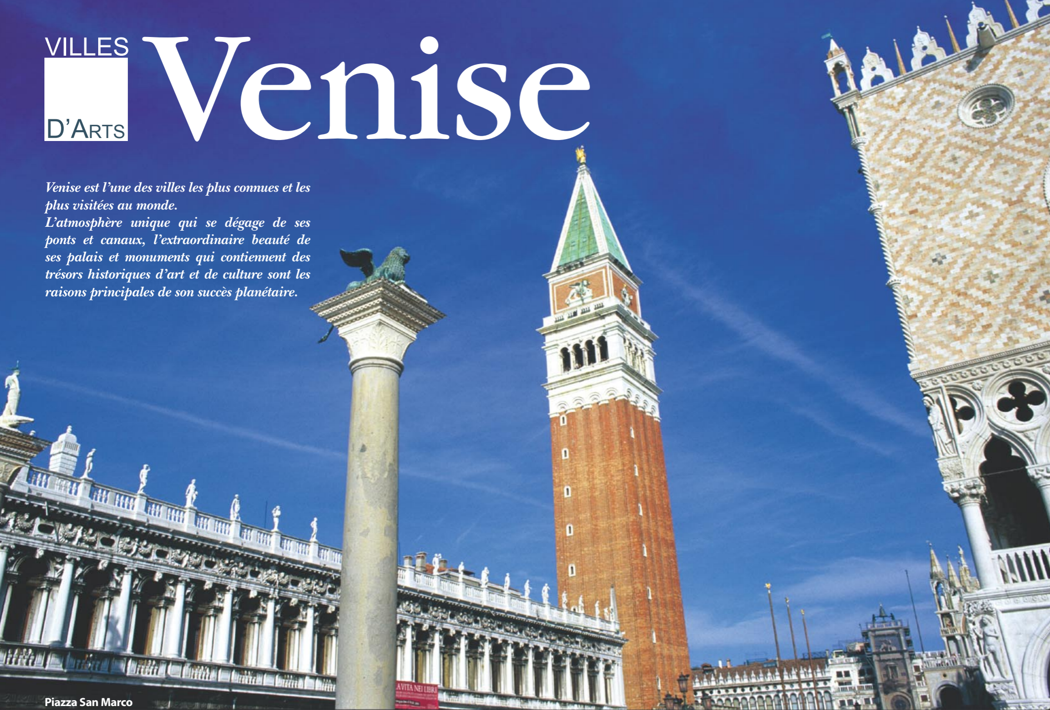
Piazza San Marco

L'atmosphère unique qui se dégage de ses ponts et canaux, l'extraordinaire beauté de ses palais et monuments qui contiennent des trésors historiques d'art et de culture sont les raisons principales de son succès planétaire.