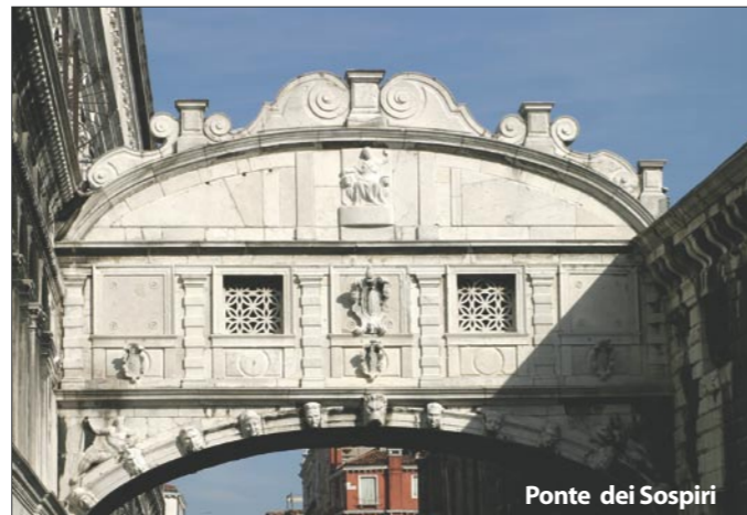
Ponte dei Sospiri

Salon du Tiepolo San Geremia, Cannaregio (Ferrovia-ligne 1-52 ACTV) Tél. : 041 781277/03 www.palazzolabia.it Fermé en 2007 pour restauration